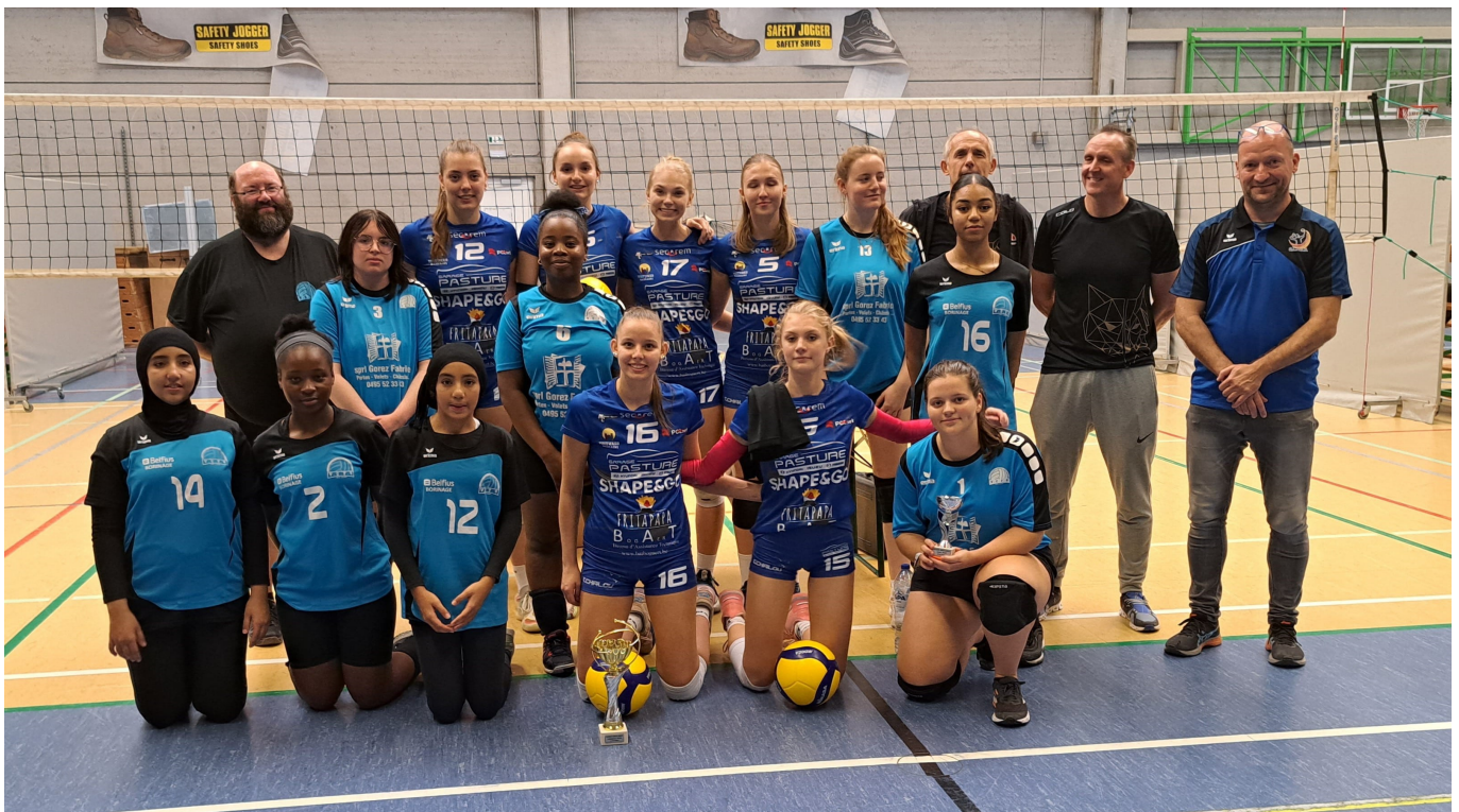
Les équipes de Thuillies et Frameries-Quaregnon